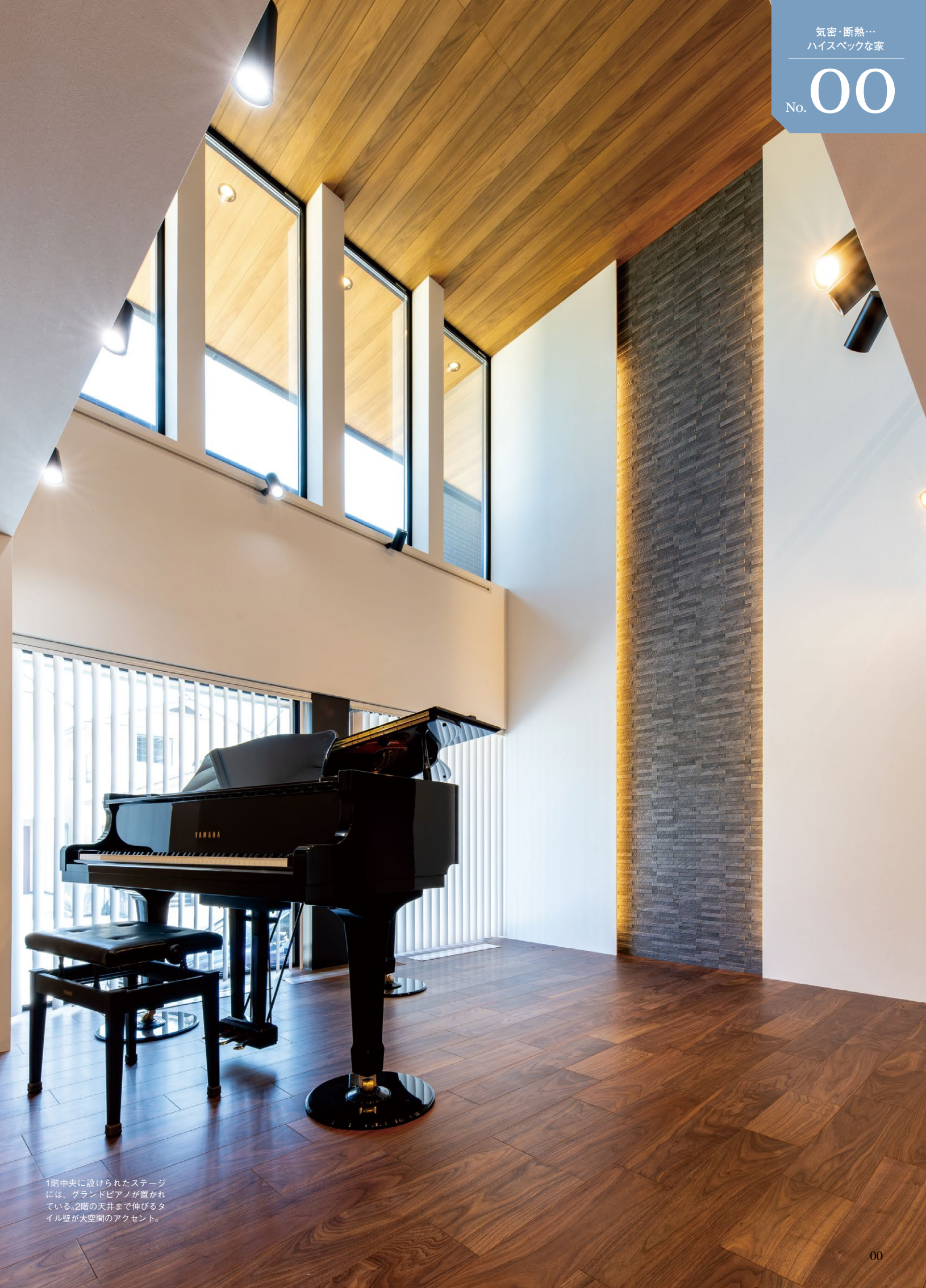
1階中央に設けられたステージには、グランドピアノが置かれている。2階の天井まで伸びるタイル壁が大空間のアクセント。